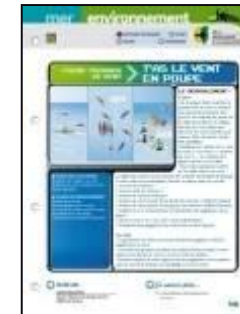
520 fiches de situation