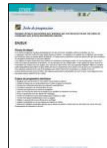
30 fiches de progression