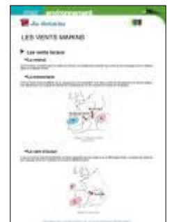
88 fiches antisèches