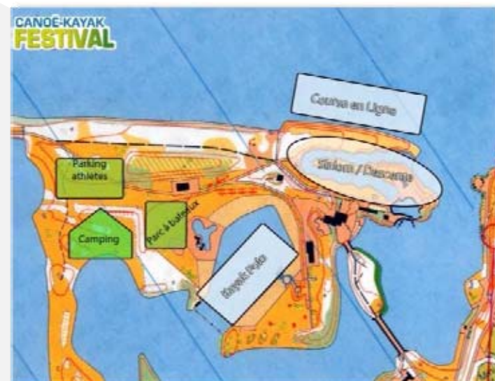
LES ZONES DE COMPETITION