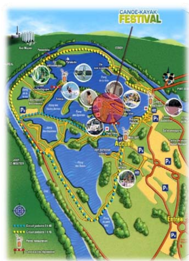
LA BASE DE LOISIRS