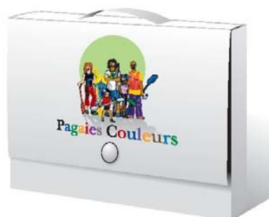
La mallette environnement

La mallette a reçu le label « Année Internationale de la Biodiversité 2010 » par le Ministère du Développement Durable le 13 avril 2010..